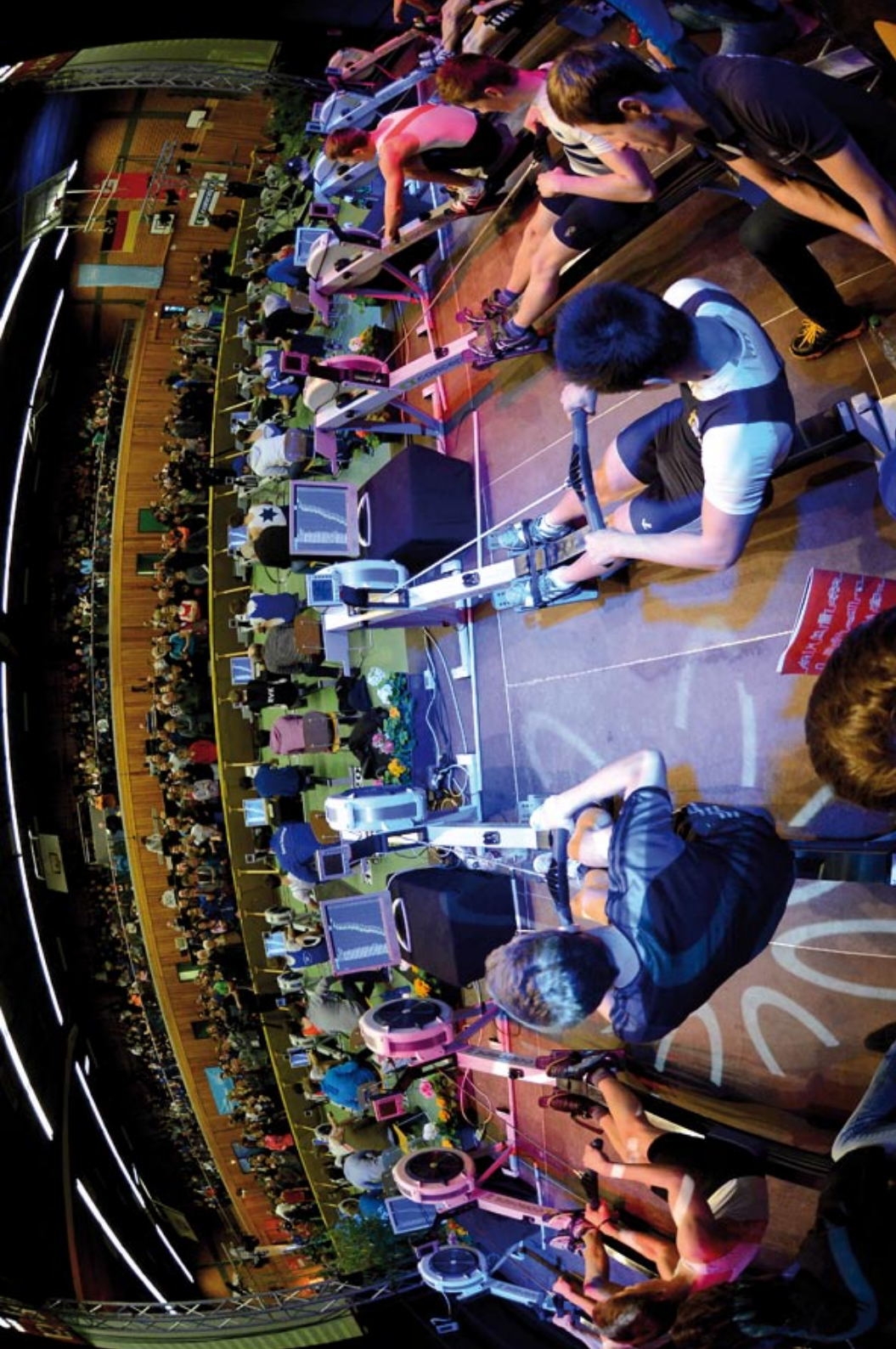
Germanen beim Indoor-Cup in Essen-Kettwig