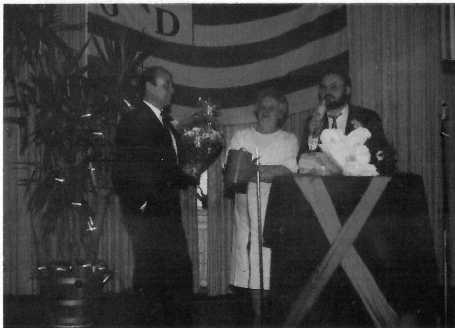
Presenting the award to the winner of the 1974-75 season.