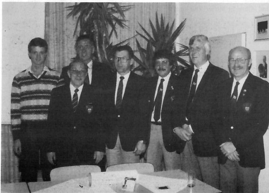
Der neue alte Vorstand

Der zweite Vorsitzende Sport ("ich bin jahrelang selber Ruderer gewesen....") gab u.a. Aufschluß über die ruderischen Ereignisse, die zum Gewinn des Stadtachters anlässlich der Feierlichkeiten "40 Jahre NRW" geführt hatten. Die Beziehungen zu dem Verein des unterlegenen Bootes sind nicht ungetrübt, gab es von dort doch heftigen Streit um den ausgesetzten Preis einer Versicherung, dem Renn-Skiff. Fazit des Volksmundes: Geld verdirbt den Charakter.